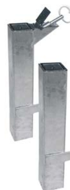
Kit d'amovibilité Serrubloc® Réf. 203402