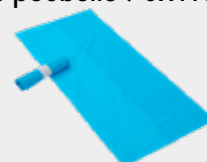
Sacs poubelle 70x110x0.025