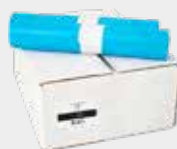
Sacs poubelle 70x110x0.021