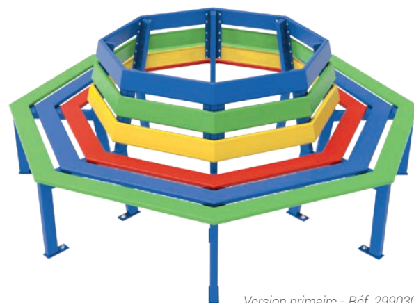
Version primaire - Réf. 299030