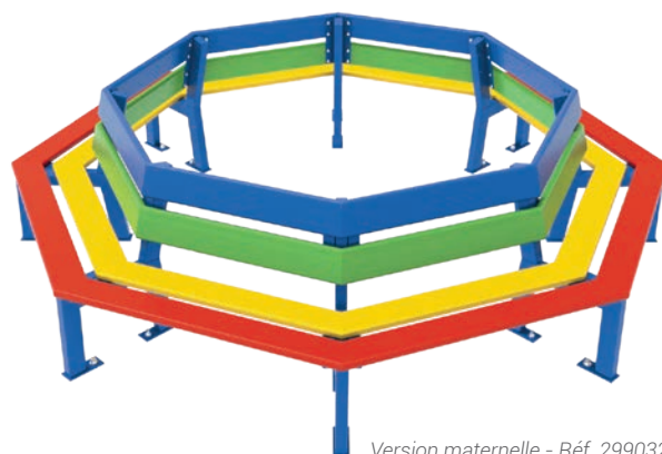
Version maternelle - Réf. 299032