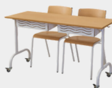
Table D'école Elementaire 1 ou 2 places Sur Roulettes Axel. REF. AX1.ORO