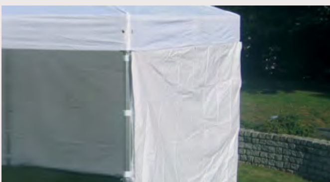
M/Y031G61 > RIDEAU BLANC 3M RIDEAU PLEIN BLANC, entoilage 450 gr/m 2 Classification antiFeu M2 - PVC anti UV