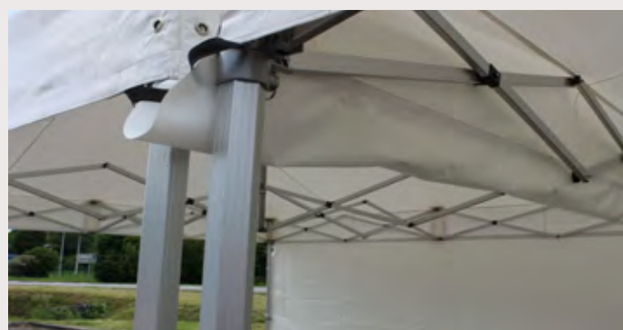
M/Y031T77 > GOUTIÈRE 3M Gouttière à mettre entre 2 stands pour l'étanchéité entoilage 450 gr/m 2 , Classification antiFeu M2 - PVC anti UV