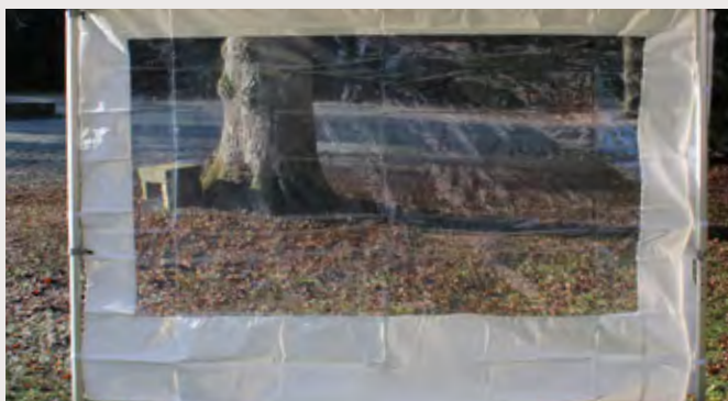
M/Y031E71 > RIDEAU FENÊTRE 3M Fenêtre cristal transparente avec entoilage 450 gr/m 2 Classification antiFeu M2 - PVC anti UV