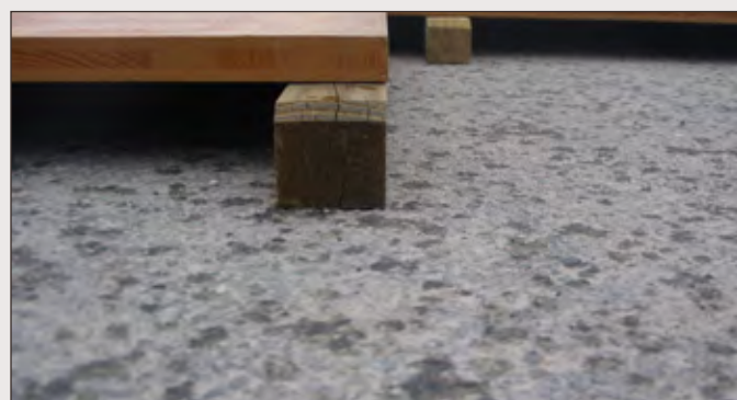
Référence plancher complet 3x3 : M/MOB1071F