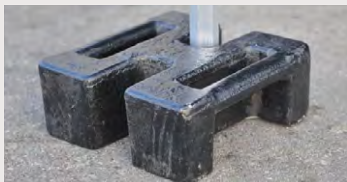
M/DIV1007L > 30 kg Poids de lestage fonte 30 kg