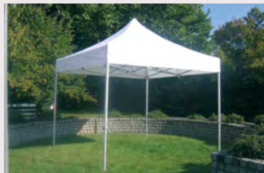
M/A783G03 >Toit, armature, housse, kit haubanage