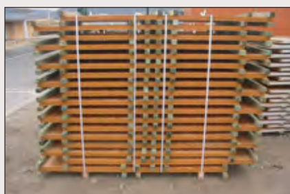
Modules 1m x 0.5m ou 2 m x 0.5m