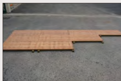
Planchers pour pose au sol

Ossature > Tri-plis pose au sol sur tasseaux