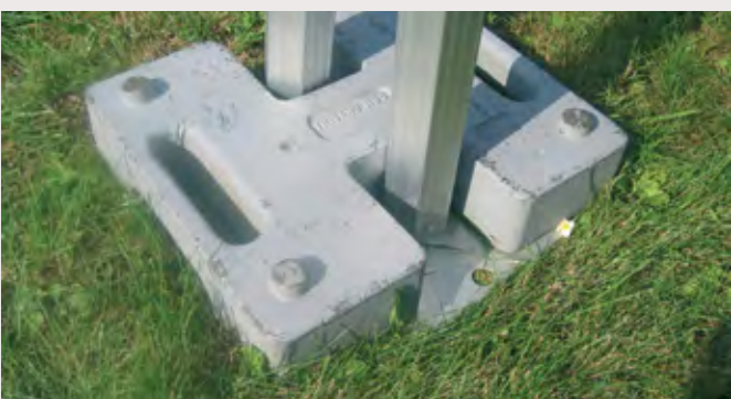
M/DIV1038W > 295 mm x 255 mm, ERGO 72x92 mm Poids de lestage fonte 20 kg