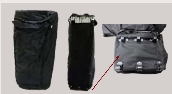
M/DIV931Z > SAC à roulette Sac en toile sur roulette, pour le transport de stands pliants, équipé de 3 roulettes sous le socle du sac