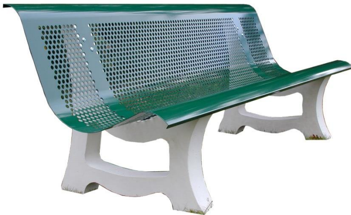
Version acier protégé corrosion laqué vert, longueur 2000 mm : LV