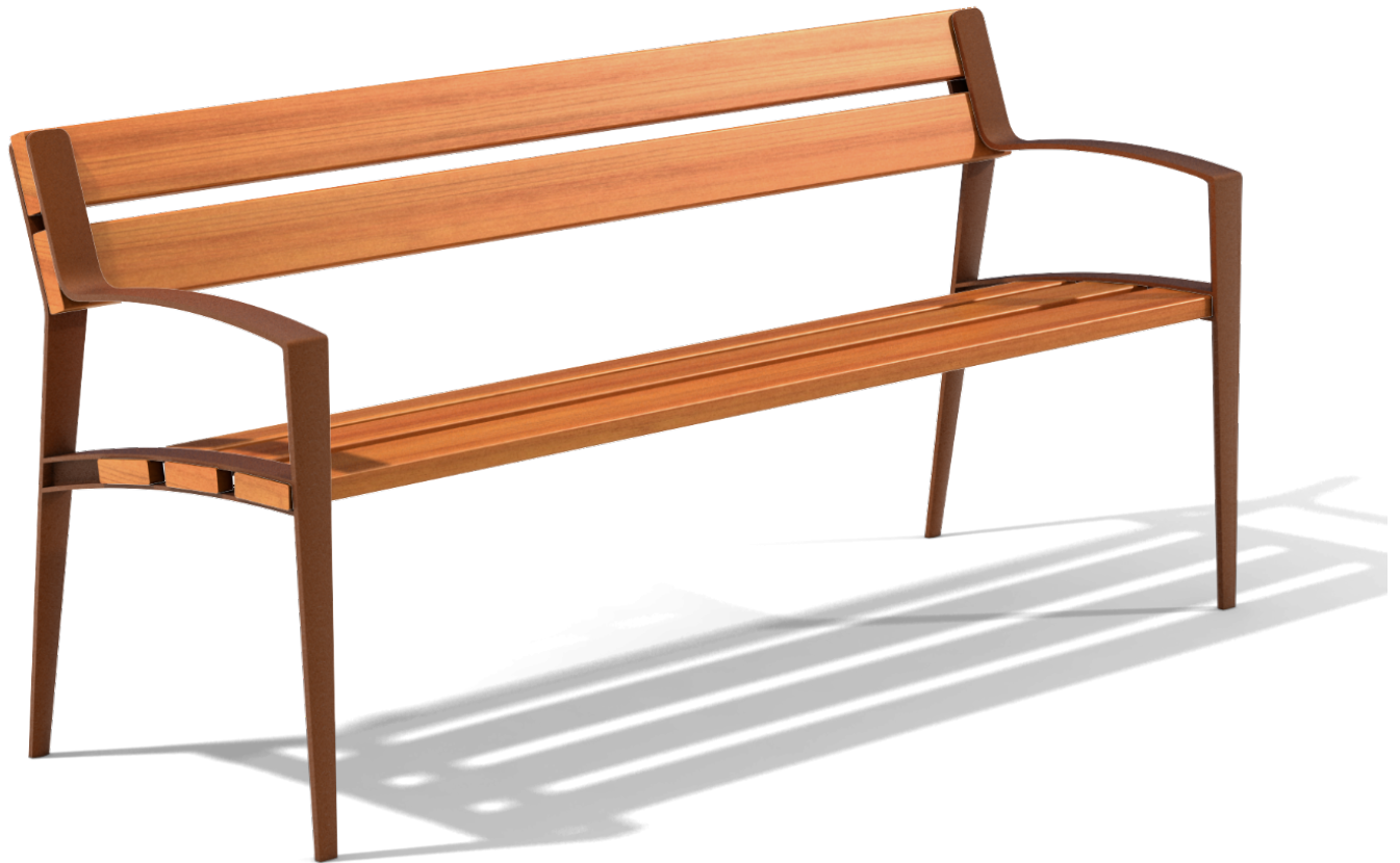
Mielek M PA691M