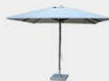
Parasol toile 3 x 3 m Sirocco