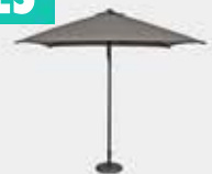
Parasol alu 250 x 250 cm tube ø 48 cm Eolo