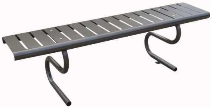
Version acier protégé corrosion laqué MANGANESE, longueur 1770 mm