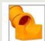
ST - tunnel