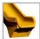
SP - polyéthylène