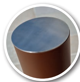
Réf. 206539 Ø 219 mm couvercle Inox brossé