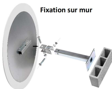
Fixation sur mur

Incluse avec le miroir. Elle permet la pose sur tous les poteaux de 60 à 90 mm de section ou directement sur le mur.